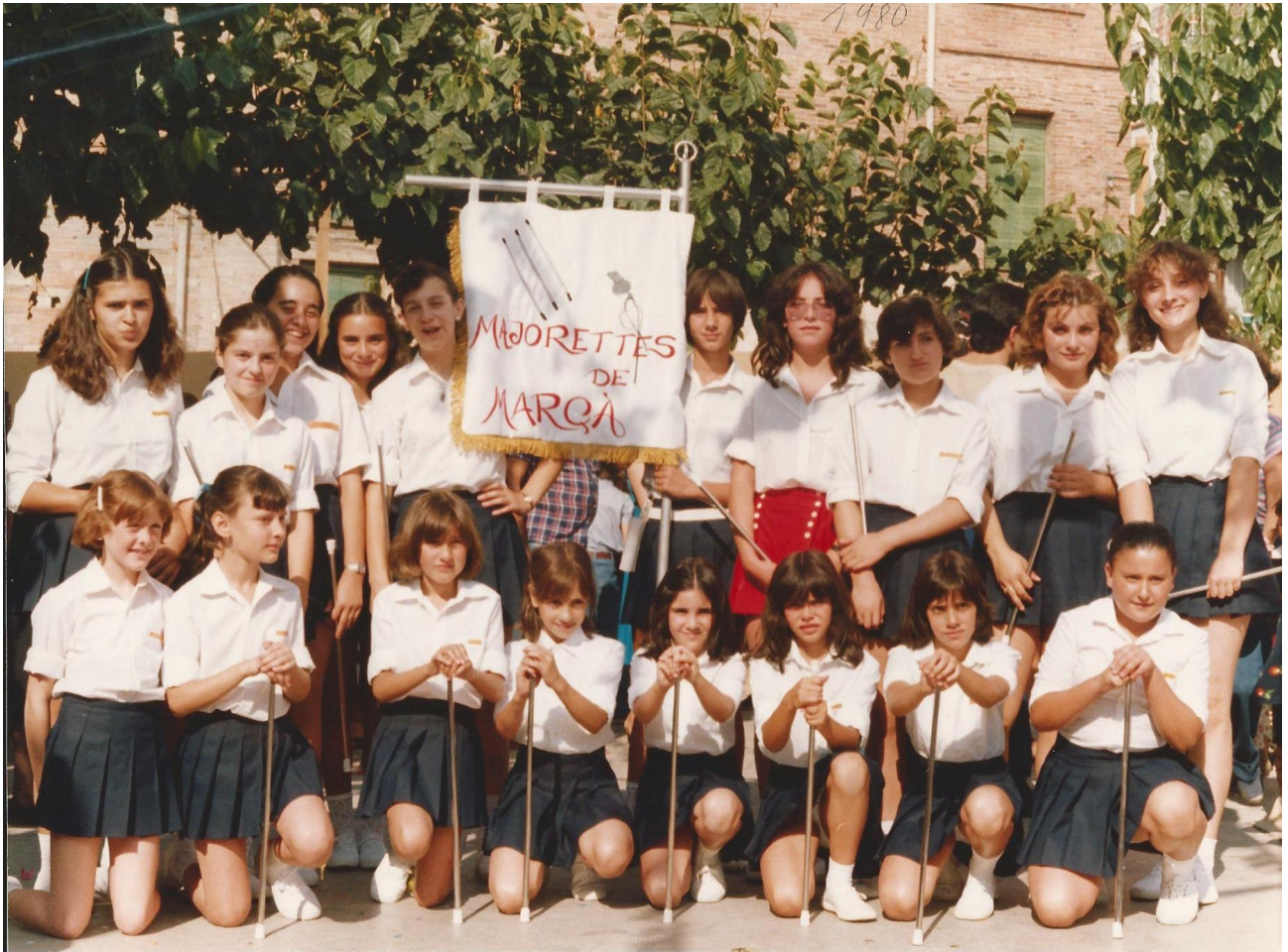
1980. Grup de majorets

El 1982 es va fer la seva inauguració oficial. Van actuar per diferents pobles.