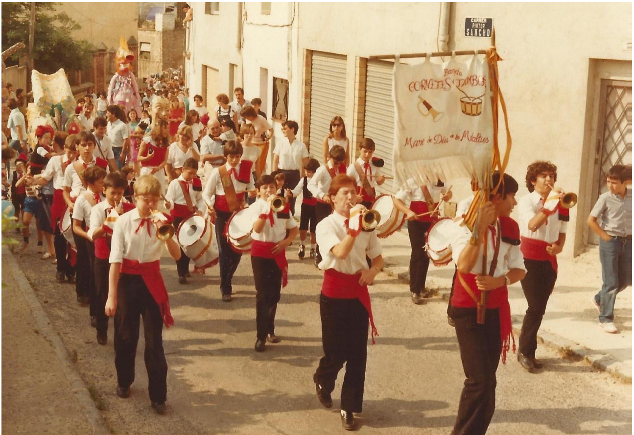
1984. Cercavila amb la banda

Van actuar a Reus, Camarles, la Palma d'Ebre, Bot, Prat de Comte, la Torre de Fontaubella, Capçanes, el Vendrell i d'altres. I també en algun concurs de bandes.